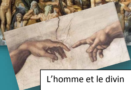
L'homme et le divin