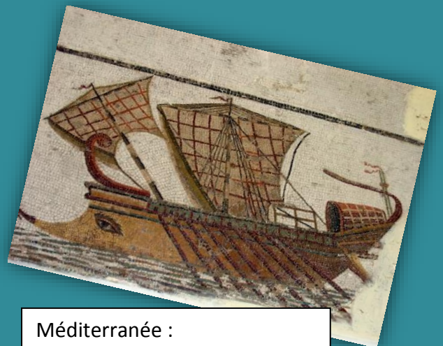
Méditerranée : Voyager, Explorer, Découvrir