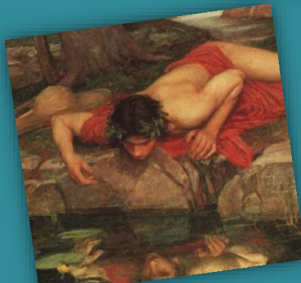
Soi-même et l'autre