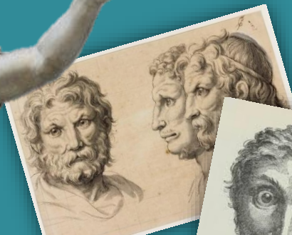
L'homme et l'animal